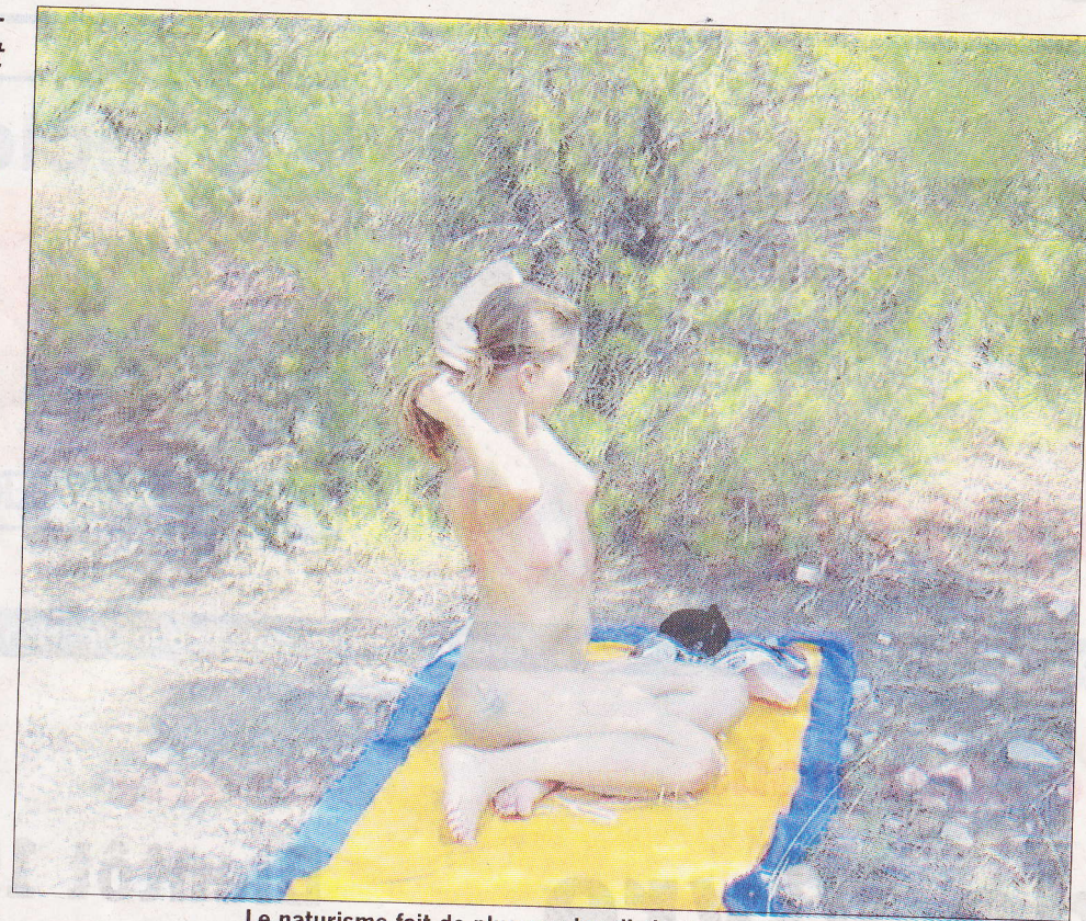
Le naturisme fait de plus en plus d'adeptes en France.

La nudité collective, dans un cadre familial, où toutes les générations se côtoient, est synonyme de liberté et de plaisir pour les naturistes, qui cherchent à vivre au calme, à pratiquer de nombreuses activités (culturelles, ludiques, sportives) dans des