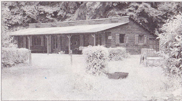
La structure est de petite taille, isolée à l'écart du village d'Harcourt.

Une philosophie plutôt positive, donc. La provocation n'est pas le but et toutes les activités pratiquées en dehors de la structure, comme les randonnées, se font habillé.